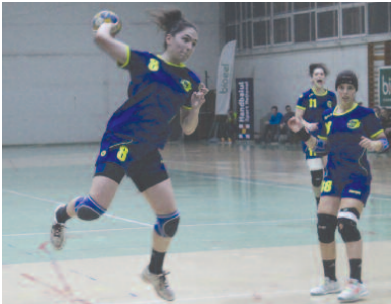
Hiába nyert magabiztosan hazai pályán a marosvásárhelyi együttes, a visszavágón simán kikapott.

Való igaz azonban, hogy az A osztályban ifjúsági csapatként beiratkozott, 16 és fél éves átlagéletkorú Olimpic számára nem az eredmény a legfontosabb az ideai bajnokságban, hanem a tapasztalatgyűjtés felnőtt együttesek ellen, ami megalapozhatja egy jövőbeni