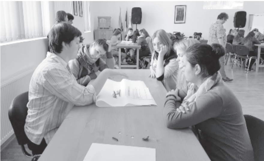
A diákok aktívan és kreatívan vettek részt a tevékenységekben, jó ötleteik voltak.