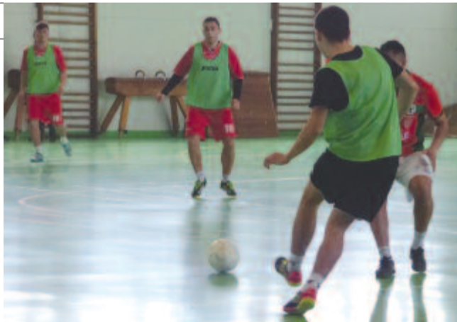
Az elmúlt hét végén mindenkinek be kellett pótolnia elmaradt mérkőzéseit.

Az elmúlt hét végén már a 9. fordulót rendezték meg az ákosfalvi téli bajnokságban, miközben minden csapatnak be kellett pótolnia elmaradt mérkőzéseit is. Így bizonyosra vehető, hogy a bajnoki cím az utolsó fordulóban dől el, hiszen a tabellát egyaránt 24 ponttal vezető Manchester és Csiba csak a 11. fordulóban csaphat össze. A 10. fordulóban Csibanak nem jelenthet gondot a sereghajtó, pont nélküli Székelyvaja legyőzése, és a Manchester is esélyes az 5. helyre visszacsúszott Somosd ellen. Ha mindkét csapat hozza a kötelező győzelmet, akkor február 25-én élet-halál harcot vívnak, ugyanis Csiba csak győzelem esetén lehet bajnok, egy döntetlen a Manchester juttatja újra bajnoki címhez, mivel behozhatatlan góledőnnyel rendelkezik (+42). Ha viszont Csiba