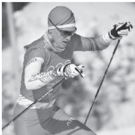
A magyarok képviselője elégedett az eredményével, „ki tudtam futni magamból mindent, ami bennem volt” – mondta a végén.

A férfiaknál a norvég Johannes Hösflot Kläbo, a nőknél pedig a svéd Stina Nilsson nyerte a sífutók keddi klasszikus stílusú egyéni sprintversenyét a pjongcsangi téli olimpián. Mindketten első ötkarikás aranyukat szereztek.